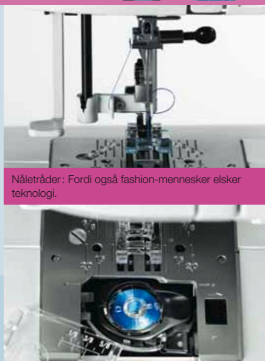
Nåletråder: Fordi også fashion-mennesker elsker teknologi.