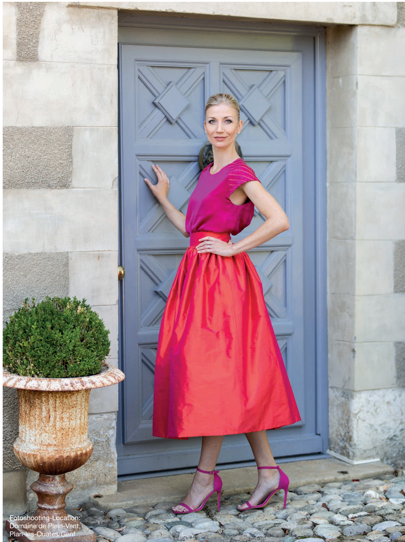
Fotoshooting-Location: Domaine de Plein-Vent, Plan-les-Ouates/Genf