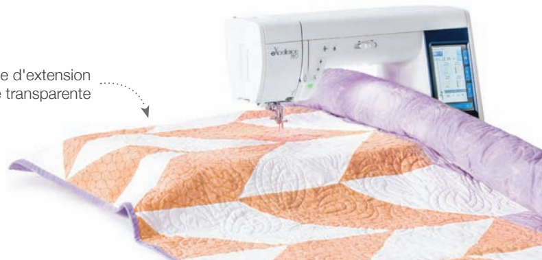
Table d'extension extra-large transparente

Pied standard, pied satin, pied satin à fourche ouverte, pied ourlet roulé, pied fermeture Éclair, pied ourlet invisible, pied patchwork 1/4 pouce, pied overlock, pied pour bouton, pied à reprendre, pied pour quilting en piqué libre avec ses trois têtes, pied boutonnière automatique avec plaque stabilisatrice, pied professionnel 1/4 de pouce, plaque aiguille professionnelle, plaque aiguille pour point droit, dispositif d'entraînement supérieur, point pivot pour couture circulaire, plaque pour tige de bouton, pédale extra-large, connexion coupe-fil, table d'extension extra-large, genouillère, guide-tissu et bien d'autres.