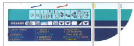
Tableau d'affichage des programmes

Les juges sont tous d'accord pour lui donner dix sur dix. Le tableau d'affichage des programmes donne toutes les informations dont vous avez besoin – rapport différentiel, longueur de point, position de l'aiguille, largeur de coupe, position de la lame couteau mobile, etc.