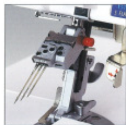
Bride-aiguille basculable, EXCLUSIVITÉ

Plus d'angoisse au moment de changer d'aiguille. Basculez la bride-aiguille et vous pouvez alors enlever ou insérer une aiguille en toute sérénité. Vous voyez clairement l'endroit où insérer l'aiguille.