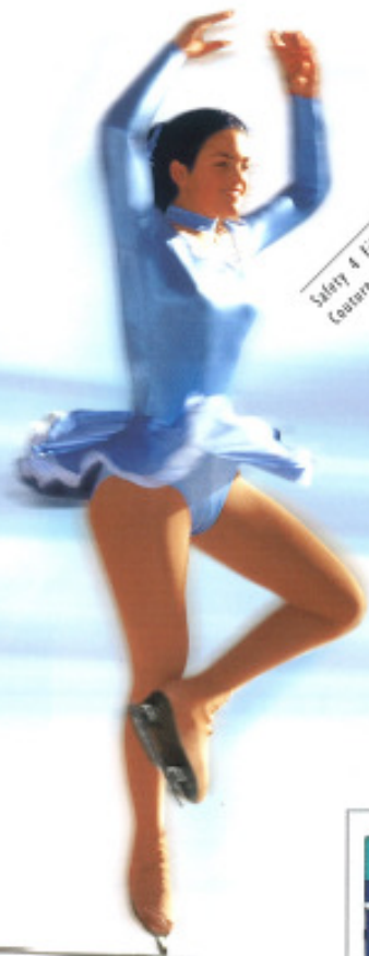
Safety 4 Fils Couture renforcée

Préparez-vous à atteindre le summum de la couture!