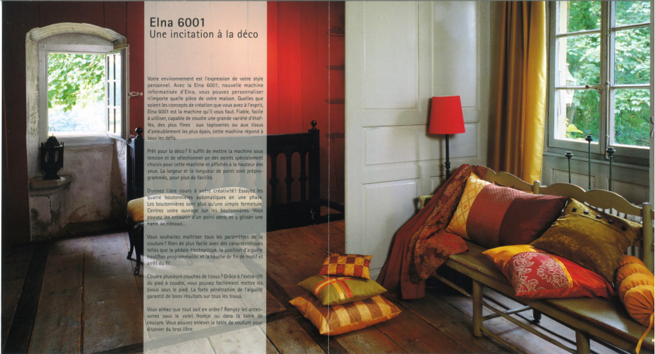
La machine Elna 6001 fournit les bases...

Vous aimez que tout soit en ordre? Rangez les accessoires sous le volet frontal ou dans la table de couture. Vous pouvez enlever la table de couture pour disposer du bras libre.