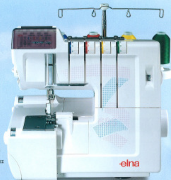
Enfilage boucleur inférieur

Si vous hésitez sur la façon de préparer la machine, il vous suffira de regarder les cartes de référence. Vous y trouverez les réglages de transport différentiel, de longueur de point et de largeur de coupe, etc. tout ce dont vous avez besoin.