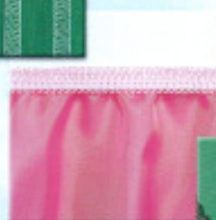
Pose de l'élastique