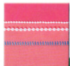
Application de perles 2 mm et 4 mm Échelle déco

A vous la joie de posséder une surjeteuse Elna 686/683.