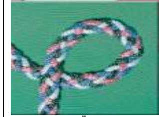
Dekoratif Saç Örgüleri