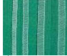
3 İplik Geniş 3 İplik