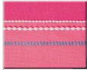
İnci Uygulaması – 2 mm v 4 mm Dekoratif Basamak

Bir Elna 686/683 overloğa sahip olmanın mutluluğu ile tanışın.