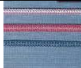
Dekoratif Yassı Kilit Dikişi 2 Dekoratif Yassı Kilit Dikişi 3