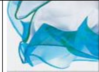
Kıvrık Kenar 2&3 Dar Kenar